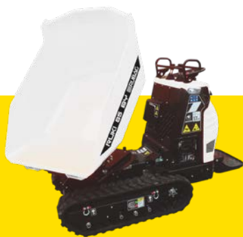
Charge utile 800 kg, largeur 835 mm, moteur diesel, benne basculante ronde.