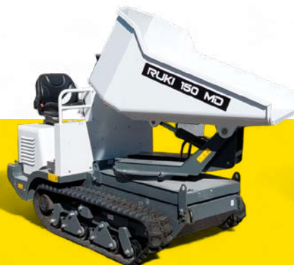
Charge utile 1'500 kg, largeur 1'108 mm, moteur diesel Stage V, benne basculante ronde.