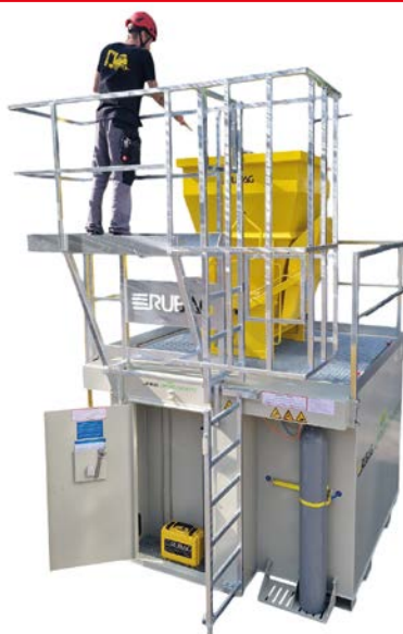
6 m 3 , idéal pour les chantiers de taille moyenne