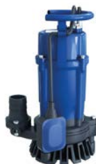
Pompe à boue JS7W