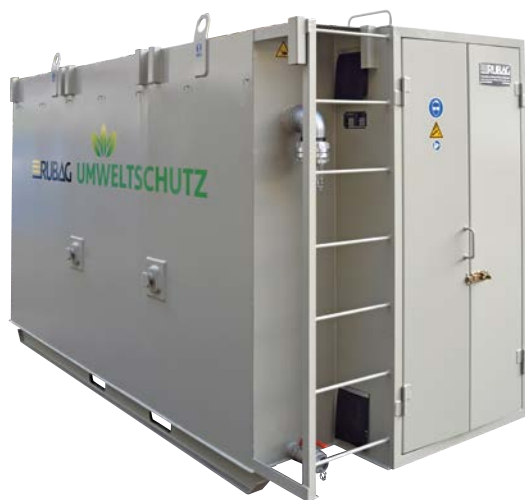
Ce bassin avec un volume de 10 m 3 et une armoire intégrée pour le système d'injection de gaz CO 2 et technique offre une solution compacte.