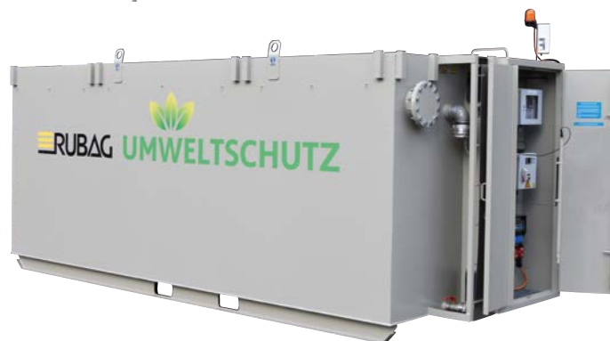
Nous recommandons pour les grands volumes d'eau nos bassins de 20 m 3 . Avec armoire intégrée pour le système d'injection de gaz CO 2 et technique. Rehausse de lavage en option.