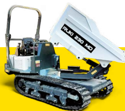
Charge utile 2'300 kg, largeur 1'300 mm, moteur diesel Stage V, benne basculante ronde.