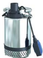
Pompe à eaux usées J4W