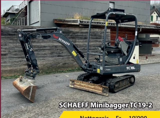
SCHAEFF Minibagger TC19-2