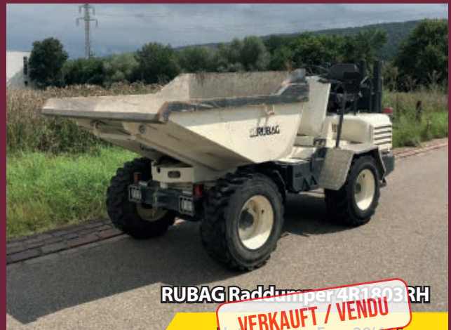
RUBAG Raddumper 4R1803 RH