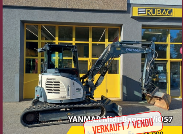
YANMAR Midi-Bagger M1057