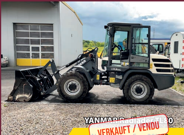
YANMAR Radlader TL80